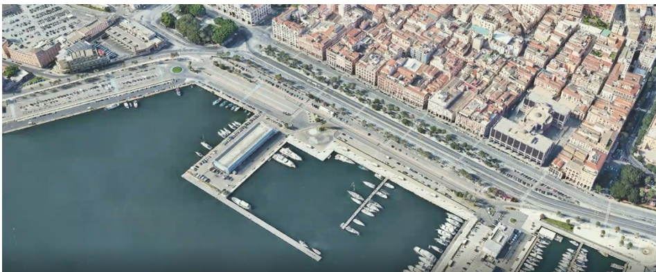
Il frontemare di Cagliari oggi

Costruire una nuova immagine della Città di Cagliari come Città del Mediterraneo e della Sostenibilità , luogo ideale per vivere e lavorare, meta internazionale apprezzata e ricercata da visitatori e turisti.