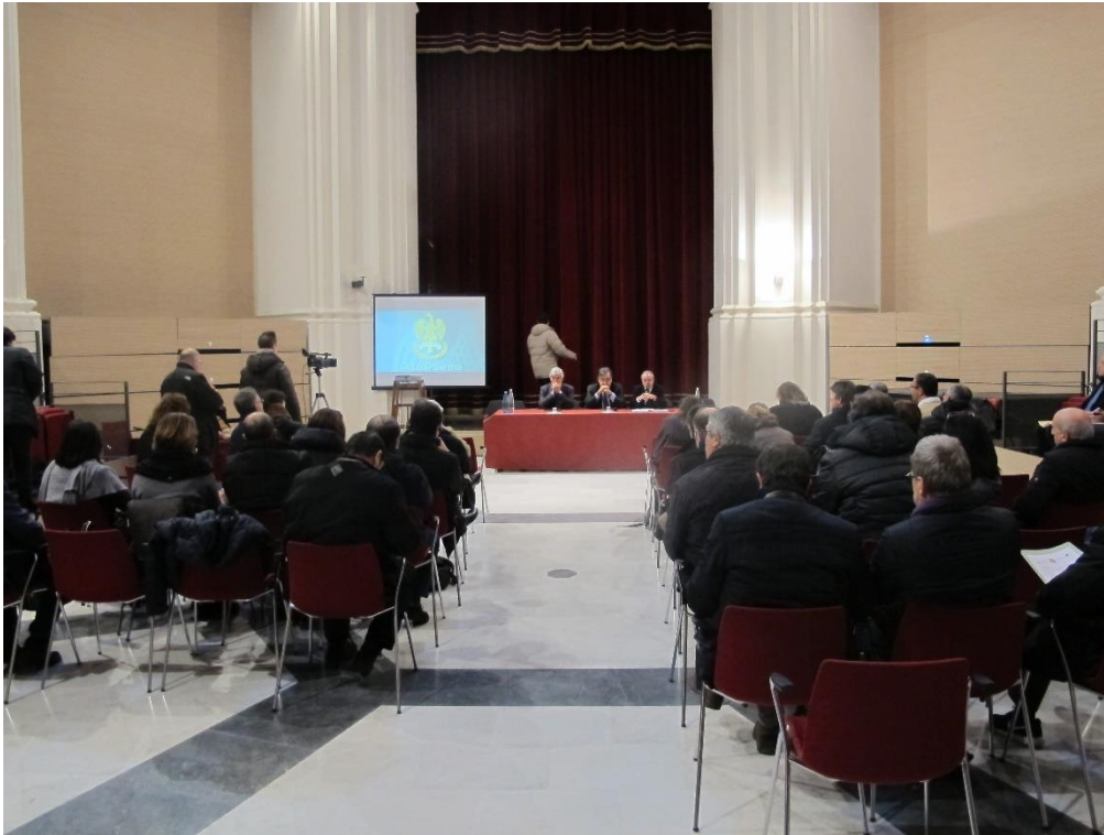
Figura 4 – Il Noviziato dei Crociferi, sede del convegno

UNIONE EUROPEA Fondo Sociale Europeo Fondo Europeo di Sviluppo Regionale