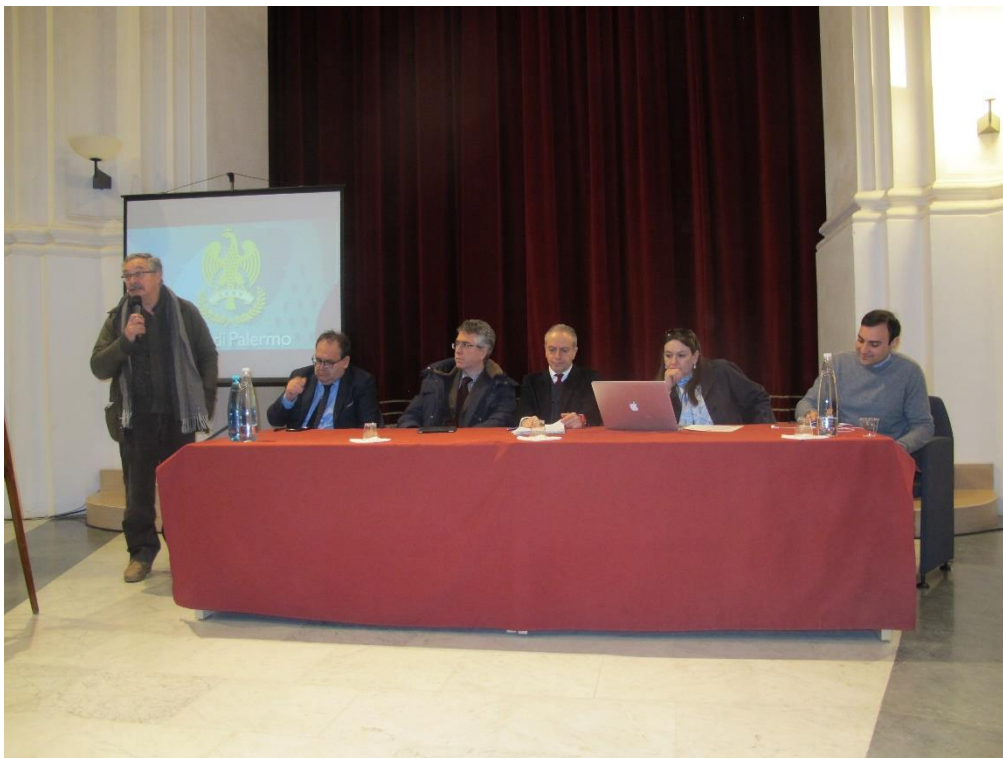
Figura 6 – Interventi dei Sindaci dei Comuni dell'area metropolitana (Carini)