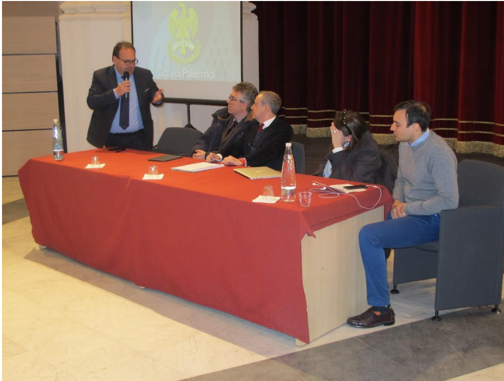
Figura 6 – Interventi dei Sindaci dei Comuni dell'area metropolitana (Isola delle Femmine)

UNIONE EUROPEA Fondo Sociale Europeo Fondo Europeo di Sviluppo Regionale