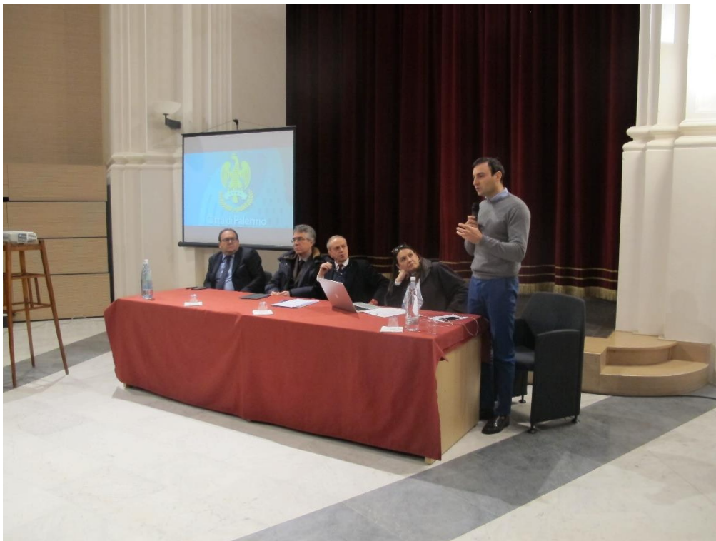
Figura 5 – Interventi dei Sindaci dei Comuni dell'area metropolitana (Ventimiglia)

UNIONE EUROPEA Fondo Sociale Europeo Fondo Europeo di Sviluppo Regionale