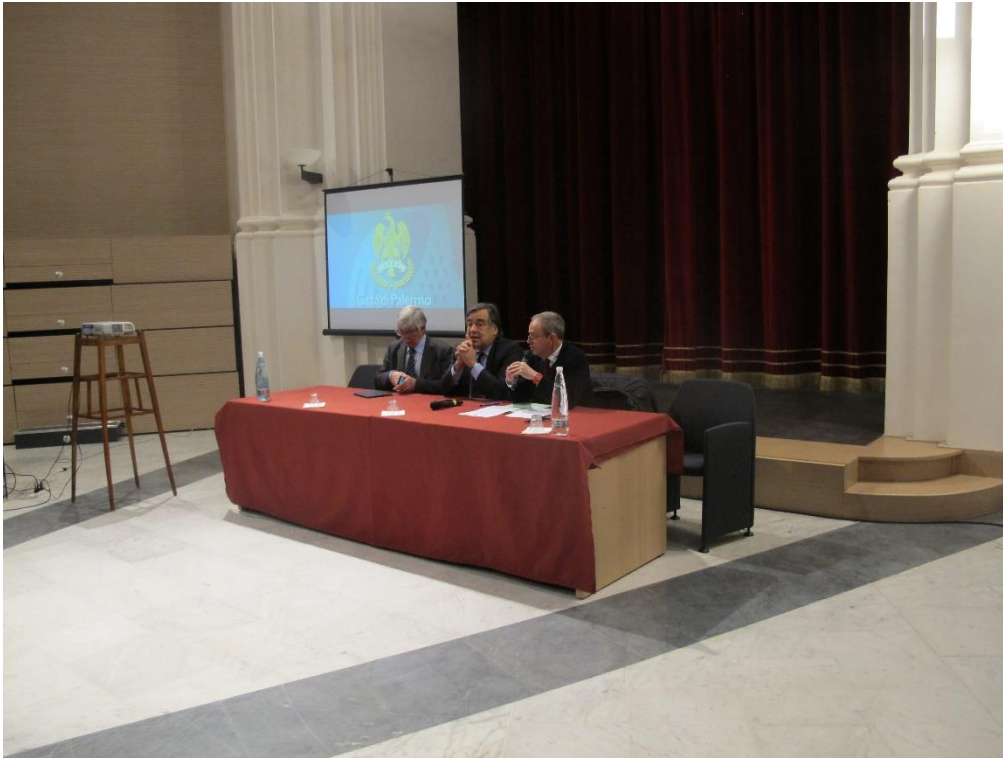
Figura 1 - Apertura dei lavori con il Sindaco, il Vicesindaco e l'Assessore alla Innovazione