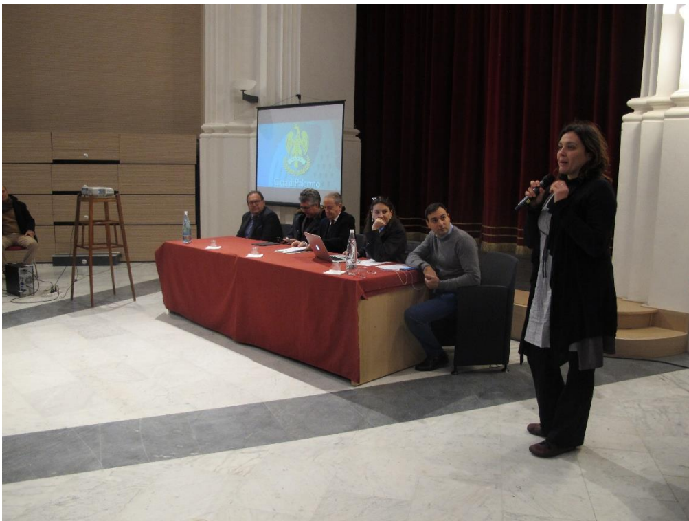
Figura 5 – Intervento dell'Assessore alla Cittadinanza Sociale sui progetti dell'Asse 3 del Programma